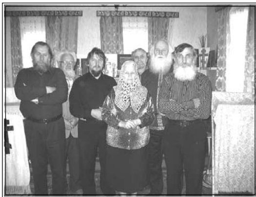
Участники заседания Центрального Совета в молитвенном доме Минской общины.

3. Рассмотрен перечень статей для будущего 8-го номера «Вестни-