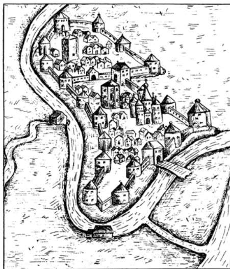
Полоцк. Гравюра XVI века.

200 лет общине – по документальным свидетельствам. Фактически же несомненно больше. В советские годы храм общины был разрушен, но благодаря бессменному председателю, а ныне и настояте-