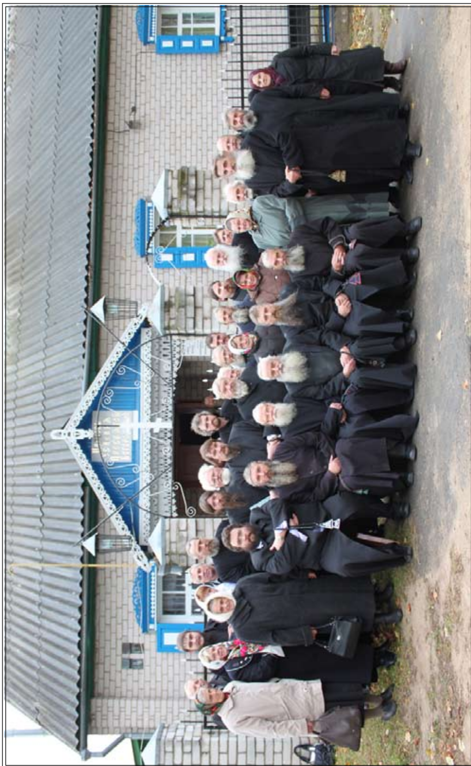
Участники Собора Древлеправославной Поморской Церкви в Беларуси. 12 октября 2010 года (по новому стилю), г. Витебск.