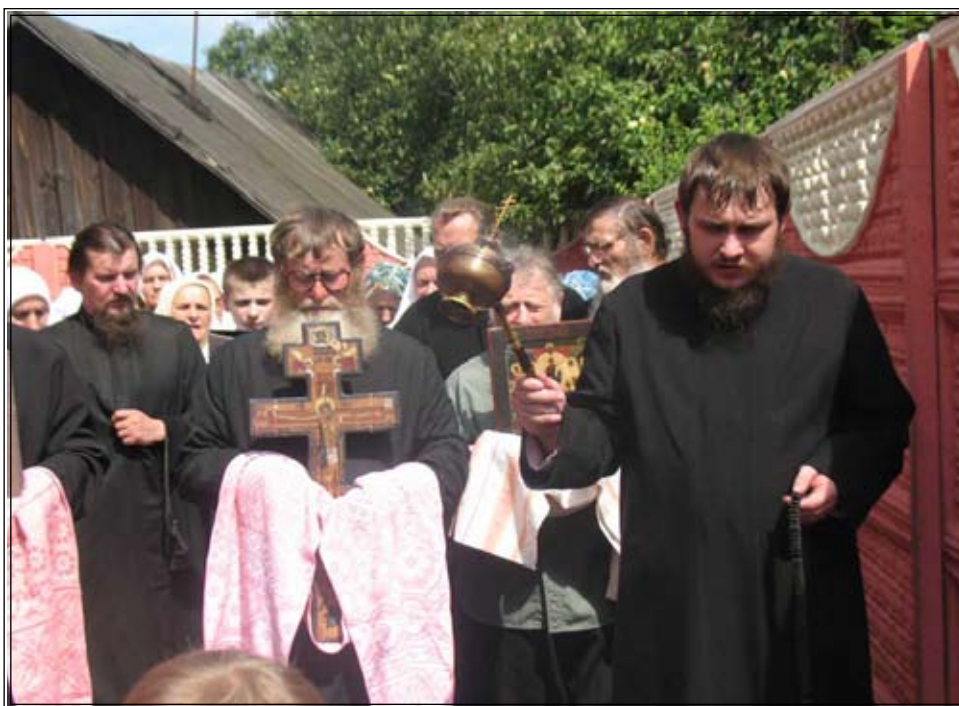
Церковные вести: празднование Казанской иконе Пресвятой Богородицы в городе Бобруйске. Крестный ход вокруг храма.